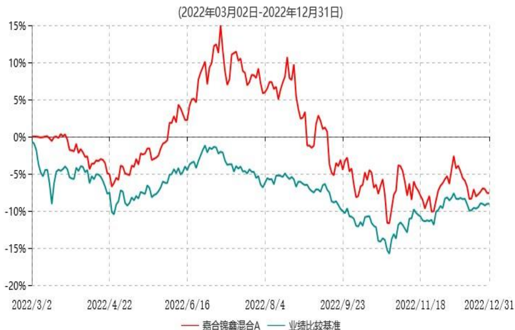
嘉合锦鑫混合A累计净值增长率与业绩比较基准收益率历史走势对比图

注：1、本基金合同于2022年03月02日生效，截至本报告期末，本基金合同生效未满一年。