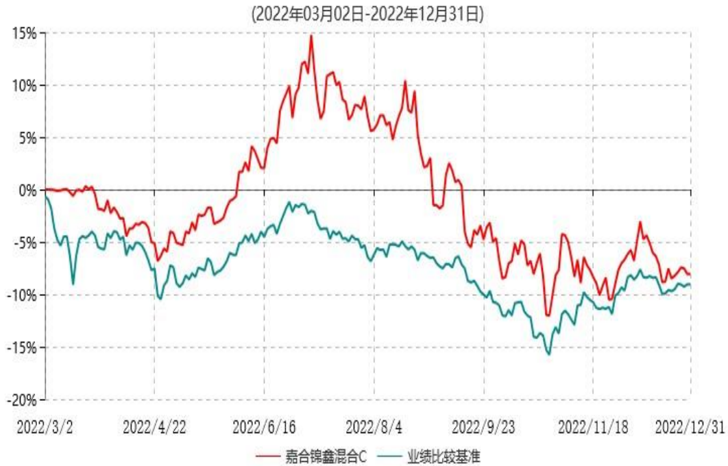
嘉合锦鑫混合C累计净值增长率与业绩比较基准收益率历史走势对比图