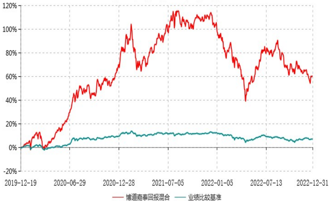
博道嘉泰回报混合型证券投资基金累计净值增长率与业绩比较基准收益率历史走势对比图 (2019年12月19日-2022年12月31日)

注：本基金建仓期为自基金合同生效日起的6个月。截至建仓期结束，本基金各项资产配置比例符合基金合同及招募说明书有关投资比例的约定。