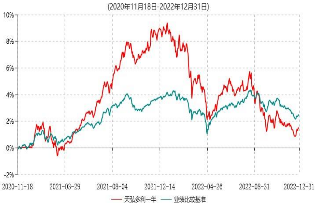
天弘多利一年定期开放混合型证券投资基金累计净值增长率与业绩比较基准收益率历史走势对比图