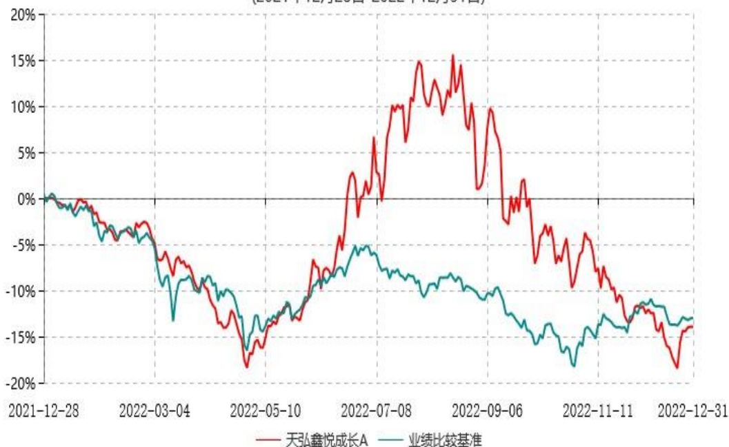
天弘鑫悦成长C累计净值增长率与业绩比较基准收益率历史走势对比图