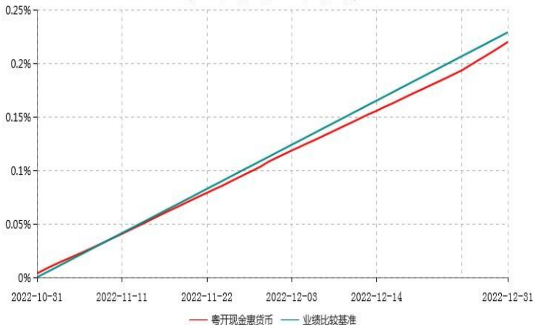
粤开现金惠货币型集合资产管理计划累计净值收益率与业绩比较基准收益率历史走势对比图 (2022年10月31日-2022年12月31日)