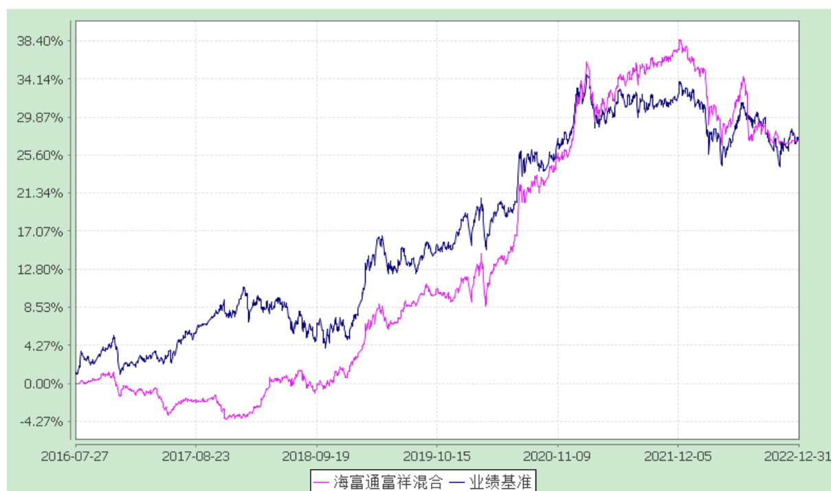
海富通富祥混合型证券投资基金 份额累计净值增长率与业绩比较基准收益率的历史走势对比图 (2016 年 7 月 27 日至 2022 年 12 月 31 日)

注：本基金合同于 2016 年 7 月 27 日生效，按基金合同规定，本基金自基金合同生效起 6 个月内为建仓期。建仓期结束时本基金的各项投资比例已达到基金合同第十二部分（二）投资范围、（四）投资限制中规定的各项比例。