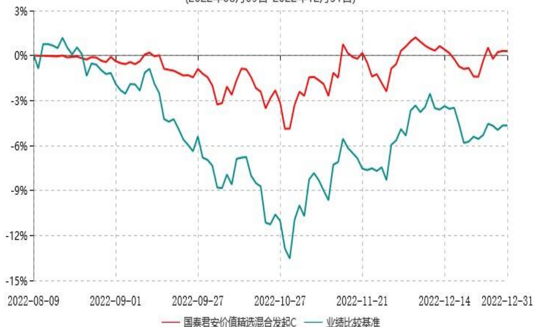
国泰君安价值精选混合发起C累计净值增长率与业绩比较基准收益率历史走势对比图 (2022年08月09日-2022年12月31日)

注：1、本基金于2022年8月9日成立，自合同生效日起至本报告期末不足一年。 2、按基金合同和招募说明书的约定，本基金的建仓期为六个月，建仓期结束时各项资产配置比例符合基金合同的有关约定。