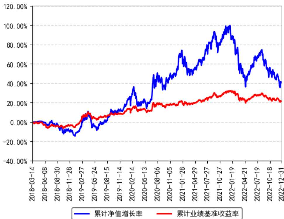
南方希元可转债债券累计净值增长率与同期业绩比较基准收益率的历史走势对比图