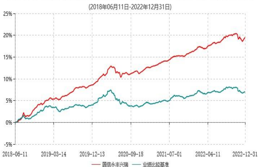
圆信永丰兴瑞6个月定期开放债券型发起式证券投资基金累计净值增长率与业绩比较基准收益率历史走势对比图