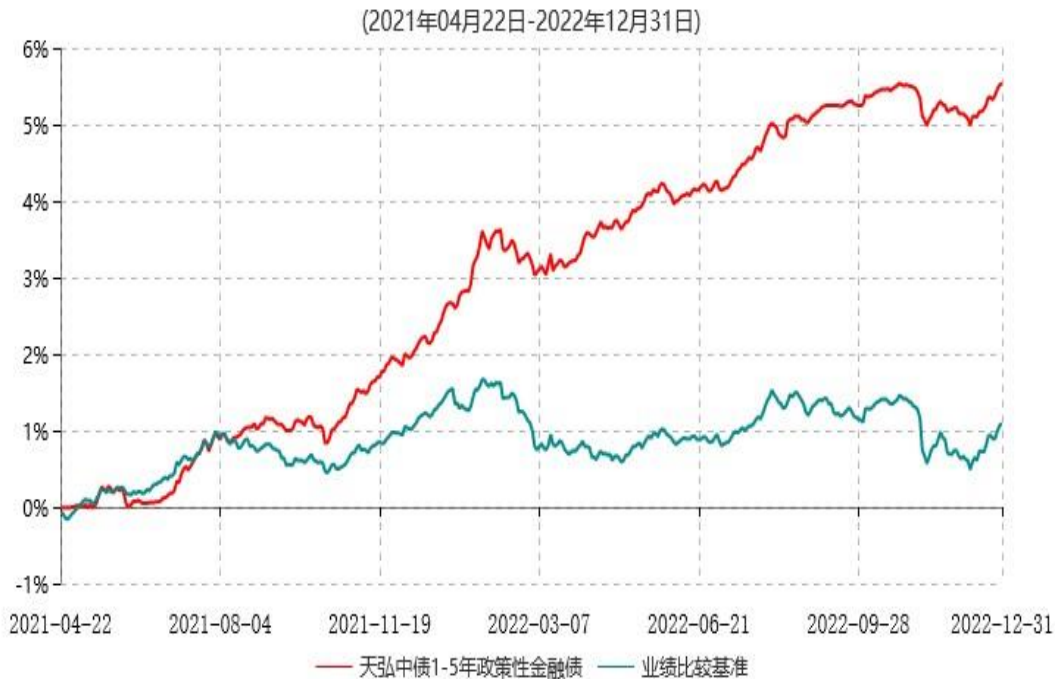
天弘中债1-5年政策性金融债指数发起式证券投资基金累计净值增长率与业绩比较基准收益率历史走势对比图