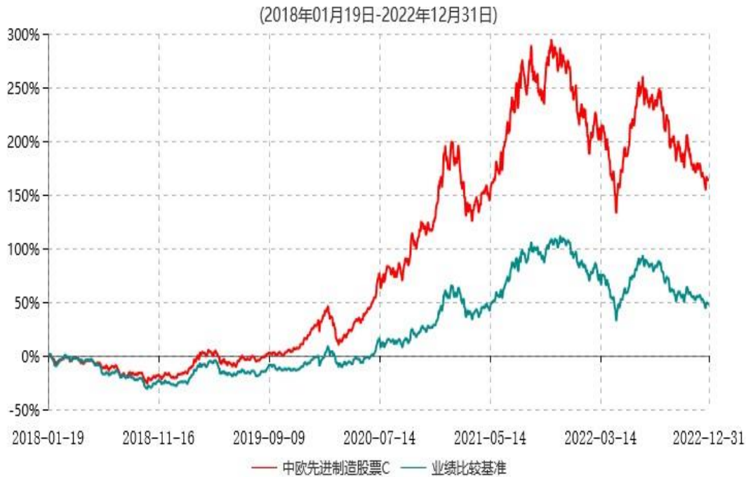
中欧先进制造股票C累计净值增长率与业绩比较基准收益率历史走势对比图

注：自2020年8月14日起，本基金的业绩比较基准由“申银万国制造业指数收益率*75%+恒生指数收益率*10%+中证综合债券指数收益率*15%”修改为“中证新能源指数收益率*60%+中证高端装备制造指数收益率*20%+中证港股通工业综合指数收益率*10%+中证短债指数收益率*10%”。