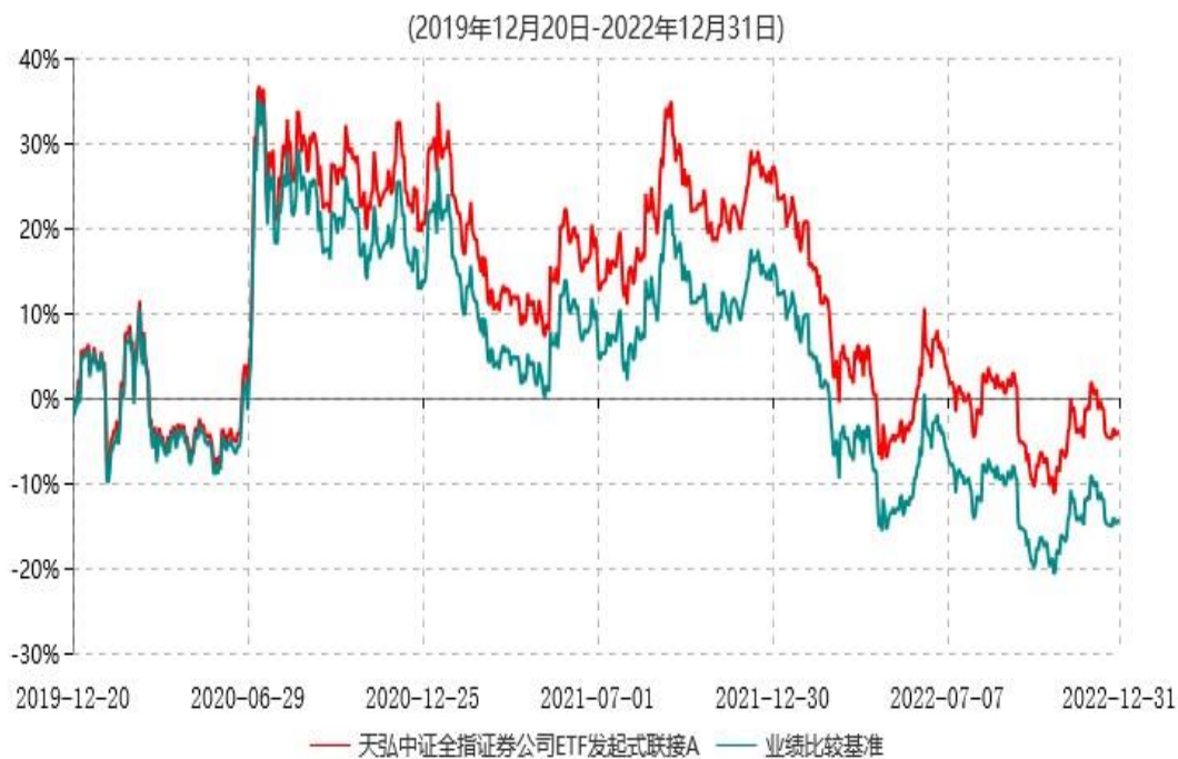
天弘中证全指证券公司ETF发起式联接A累计净值增长率与业绩比较基准收益率历史走势对比图