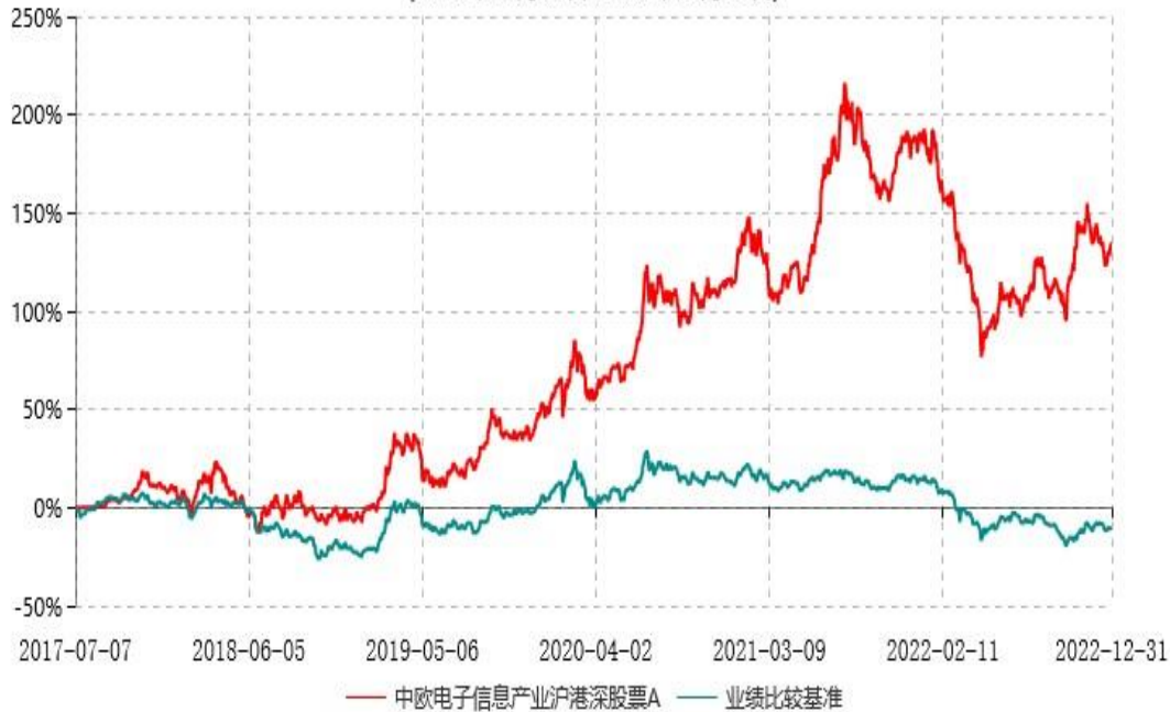
中欧电子信息产业沪港深股票A累计净值增长率与业绩比较基准收益率历史走势对比图 (2017年07月07日-2022年12月31日)