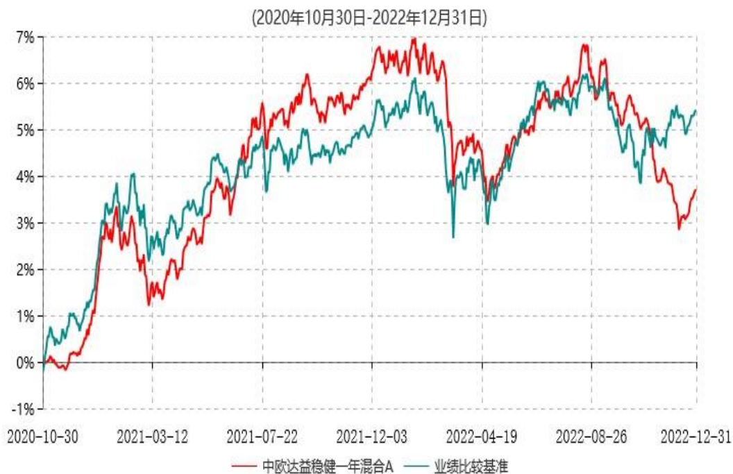
中欧达益稳健一年混合A累计净值增长率与业绩比较基准收益率历史走势对比图