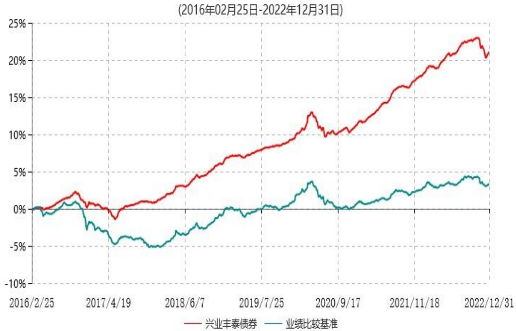
兴业丰泰债券型证券投资基金累计净值增长率与业绩比较基准收益率历史走势对比图