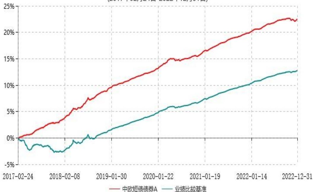
中欧短债债券A累计净值增长率与业绩比较基准收益率历史走势对比图 (2017年02月24日-2022年12月31日)

注：自2018年10月25日起，变更业绩比较基准至中债综合财富（1年以下）指数收益率。