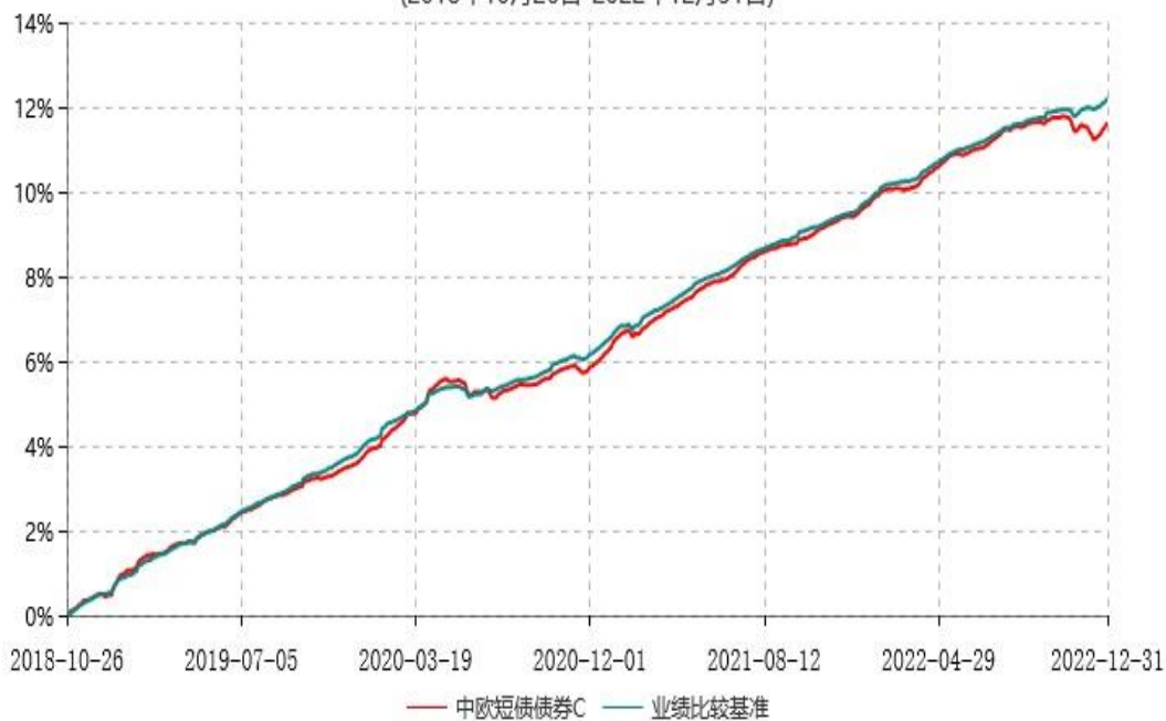
中欧短债债券C累计净值增长率与业绩比较基准收益率历史走势对比图 (2018年10月26日-2022年12月31日)

注：自2018年10月25日起，变更业绩比较基准至中债综合财富（1年以下）指数收益率。 自2018年10月25日起，本基金增加C类份额，图示日期为2018年10月26日至2022年12月31日。