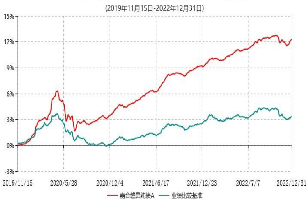
嘉合磐昇纯债A累计净值增长率与业绩比较基准收益率历史走势对比图