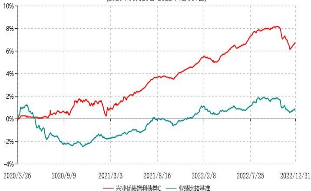
兴业优债增利债券C累计净值增长率与业绩比较基准收益率历史走势对比图 (2020年03月26日-2022年12月31日)

本基金合同自2020年3月24日起生效并增设C类份额，自2020年3月26日起C类份额存续。上述业绩表现按实际存续期计算。