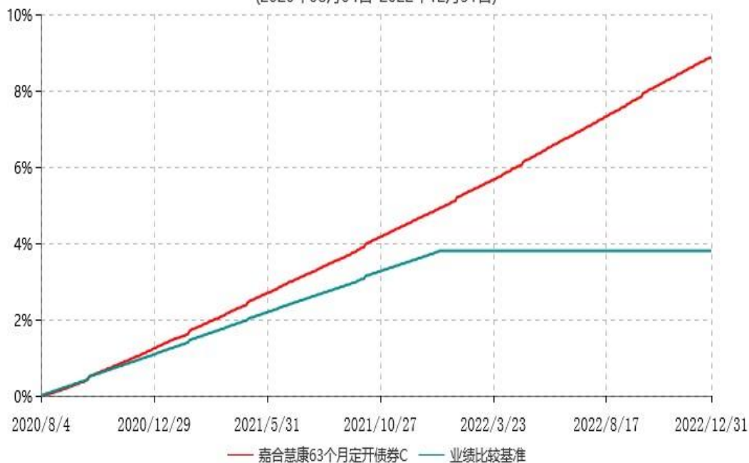
嘉合慧康63个月定开债券C累计净值增长率与业绩比较基准收益率历史走势对比图 (2020年08月04日-2022年12月31日)