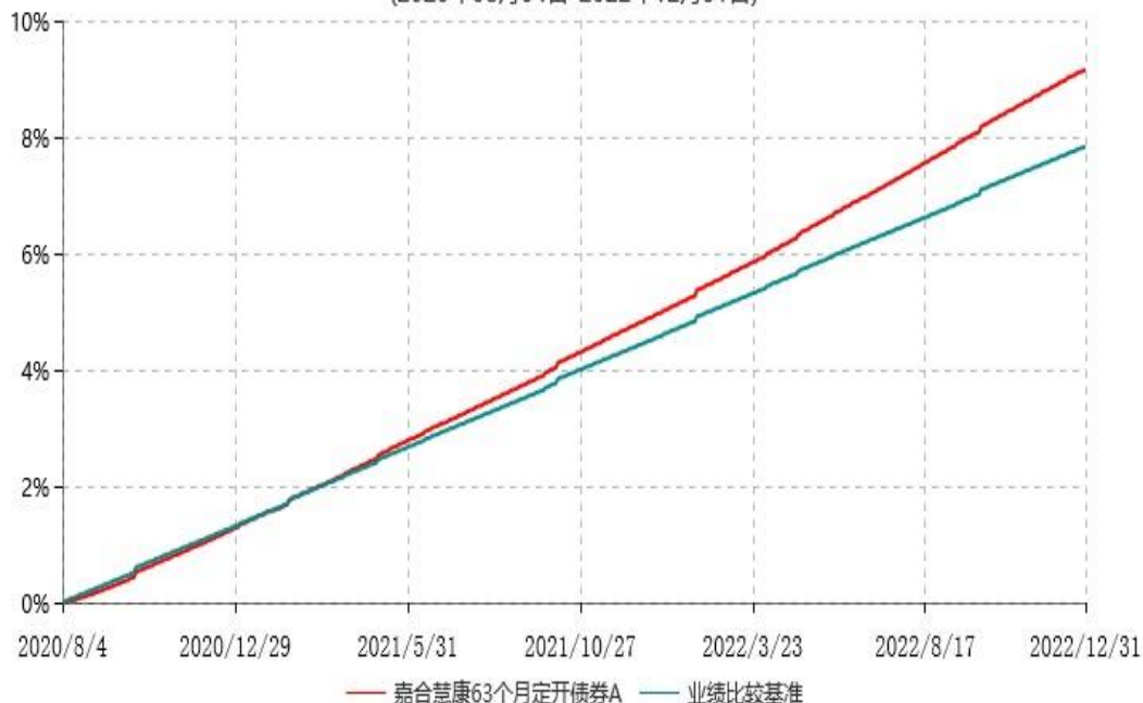
嘉合慧康63个月定开债券A累计净值增长率与业绩比较基准收益率历史走势对比图 (2020年08月04日-2022年12月31日)