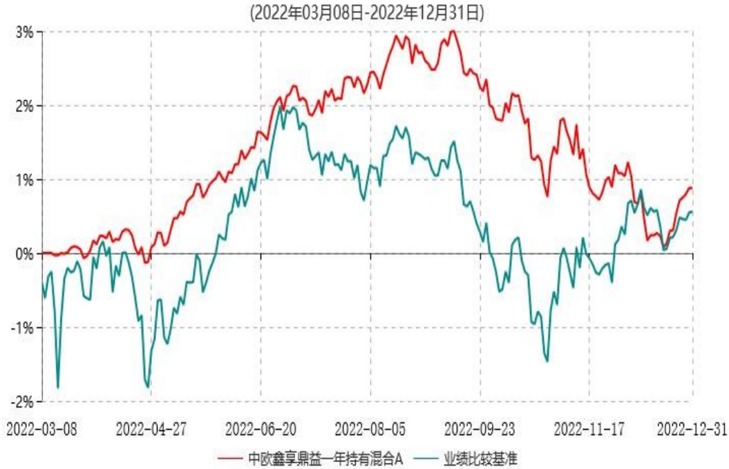
中欧鑫享鼎益一年持有混合A累计净值增长率与业绩比较基准收益率历史走势对比图

注：本基金基金合同生效日期为2022年3月8日，自基金合同生效日起到本报告期末不满一年，按基金合同的规定，本基金自基金合同生效起六个月为建仓期，建仓期结束时各项资产配置比例已符合基金合同约定。