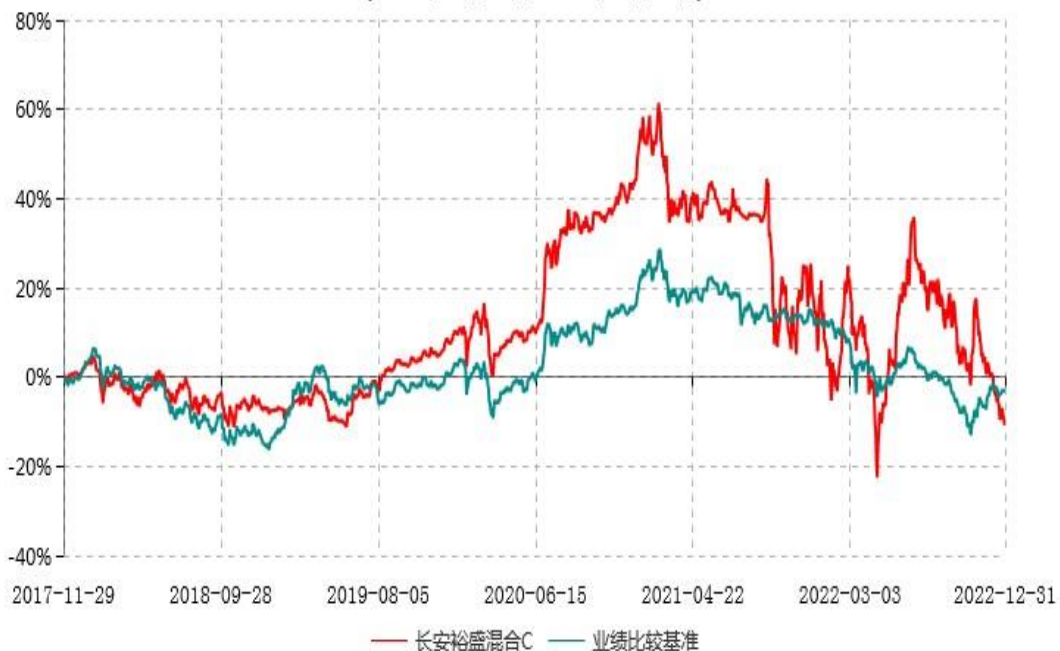
长安裕盛混合C累计净值增长率与业绩比较基准收益率历史走势对比图 (2017年11月29日-2022年12月31日)

根据基金合同的规定,自基金合同生效之日起6个月内基金各项资产配置比例需符合基金合同要求。本基金在建仓期结束后,各项资产配置比例已符合基金合同有关投资比例的约定。基金合同生效日至报告期期末,本基金运作时间超过一年。图示日期为2017年11月29日至2022年12月31日。