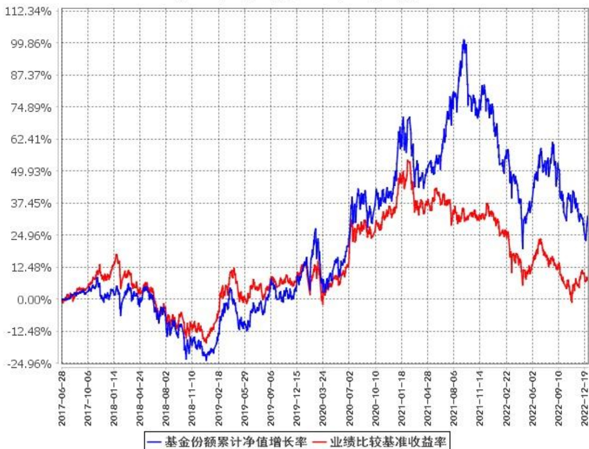
基金份额累计净值增长率与同期业绩比较基准收益率的历史走势对比图 (2017年6月28日至2022年12月31日)