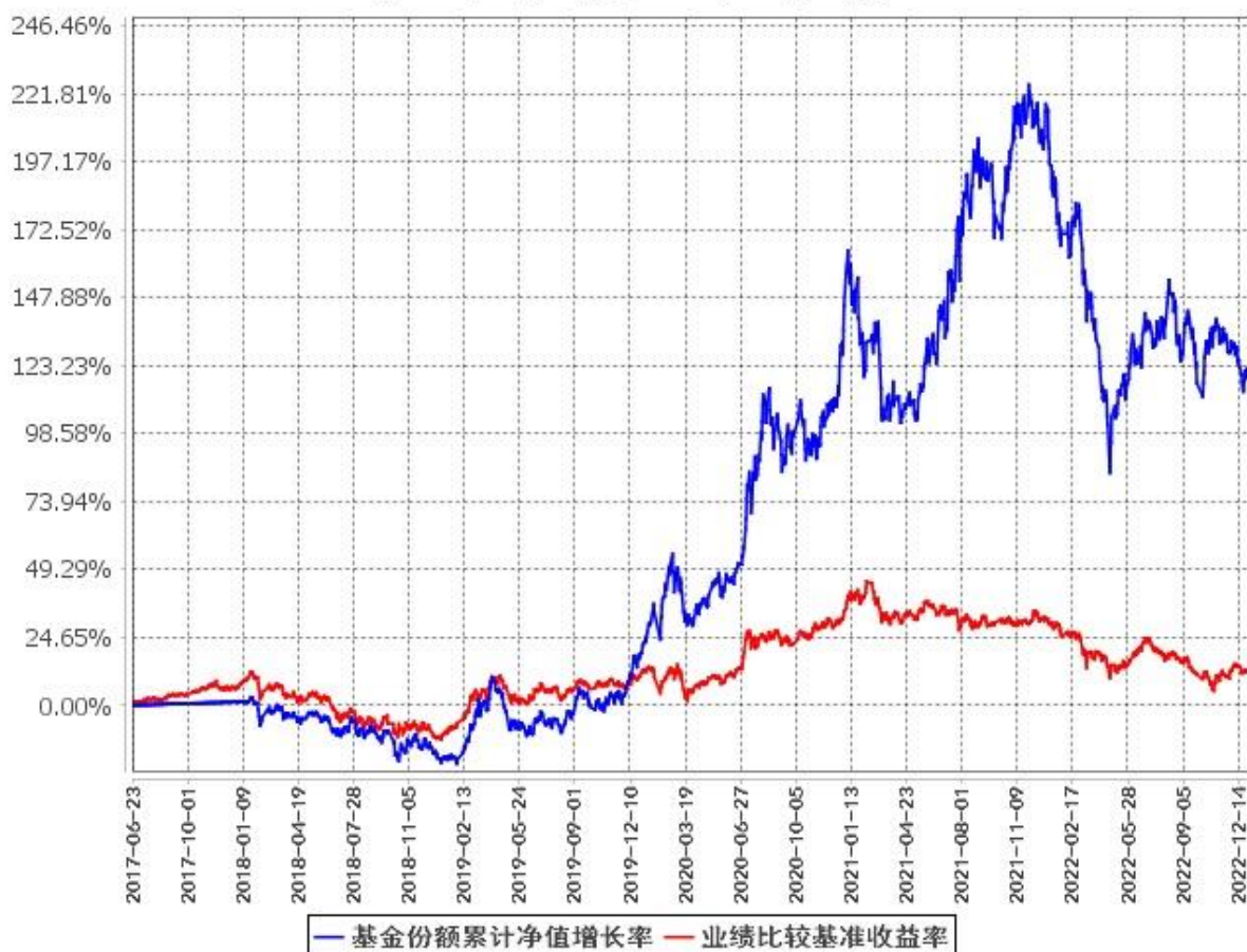
基金份额累计净值增长率与同期业绩比较基准收益率的历史走势对比图 (2017年6月23日至2022年12月31日)