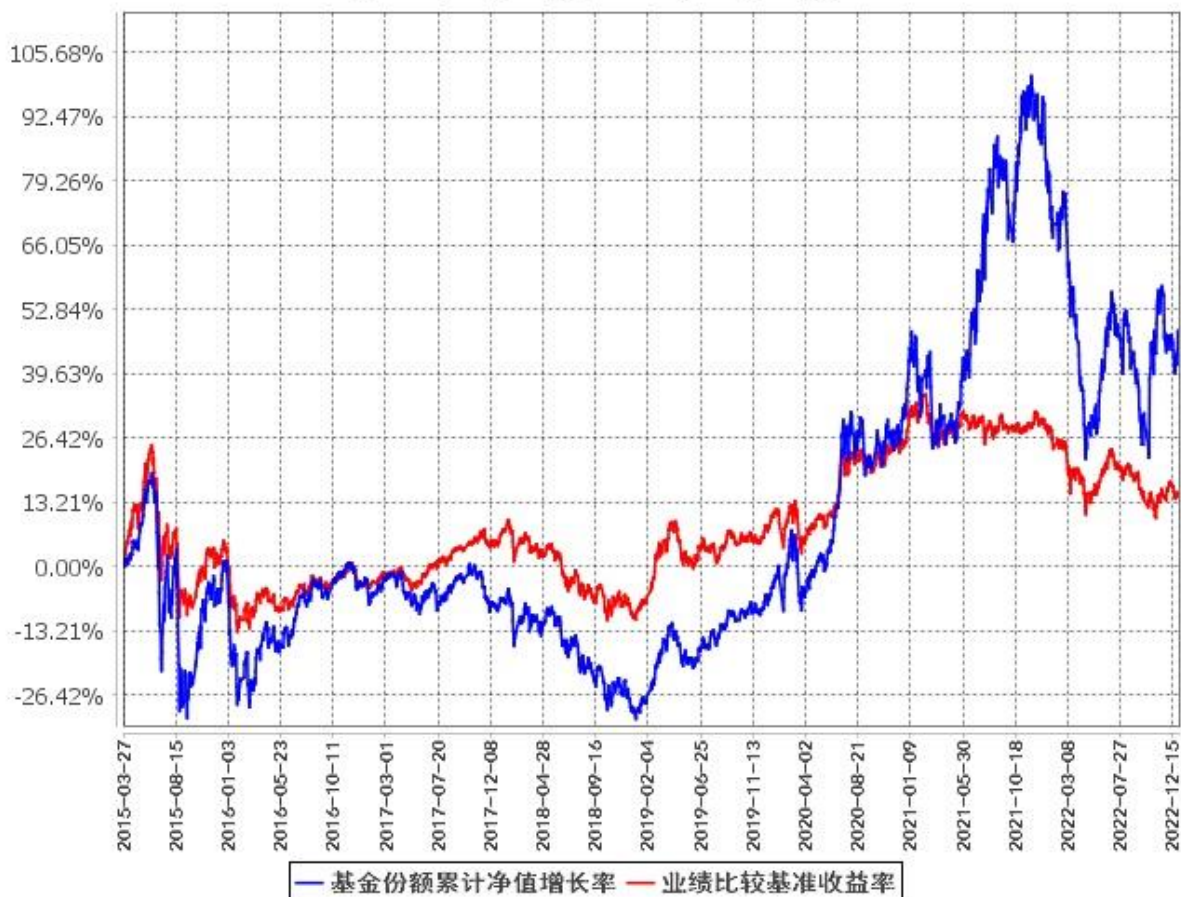
基金份额累计净值增长率与同期业绩比较基准收益率的历史走势对比图 (2015年3月27日至2022年12月31日)