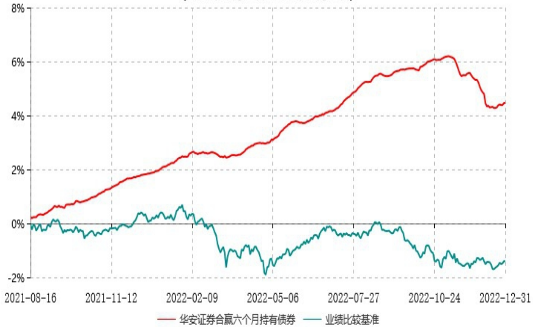
华安证券合赢六个月持有期债券型集合资产管理计划累计净值增长率与业绩比较基准收益率历史走势对比图 (2021年08月16日-2022年12月31日)