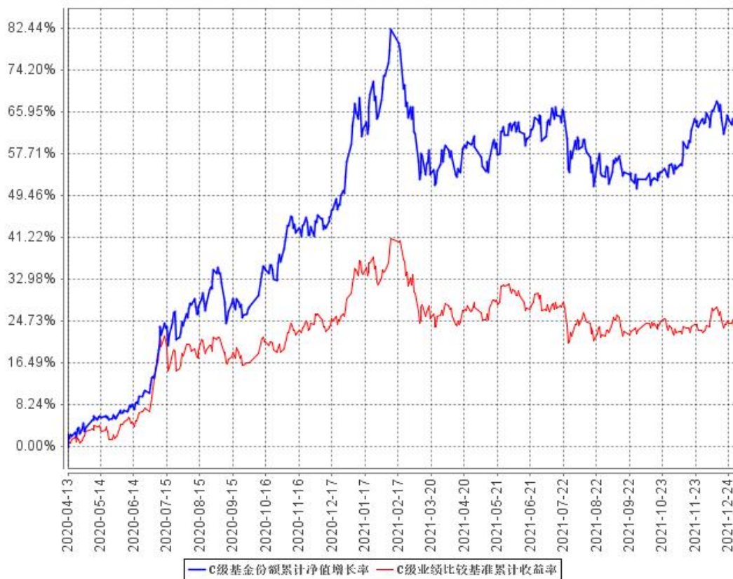
C级基金份额累计净值增长率与同期业绩比较基准收益率的历史走势对比图