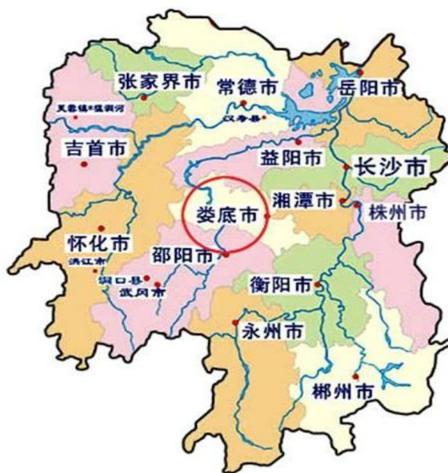
图表 5-17 娄底市区位图

娄底市是湖南省重要的省辖地级市，位于湖南地理几何中心，是湖南重要的工业城市，湖南能源、原材料战略储备基地，是环长株潭城市群的重要组成部分。沪昆铁路和沪昆高铁横穿东西，洛湛铁路和娄邵铁路纵贯南北，成为湖南重要的“十字型”铁路枢纽。沪昆高速、娄怀高速、长韶娄高速、二广高速相继全面贯通，娄底大道、益娄高速、娄衡高速、龙琅高速、娄醴高速相继规划开工建设，娄底即将步入“高速”时代。娄底通用机场建设进入准备阶段，资江水运全面升级。随着水路、高速、高铁、航空等基础建设的全面推进，娄底已成为环长株潭城市群中极具发展潜力与活力的重要节点城市。