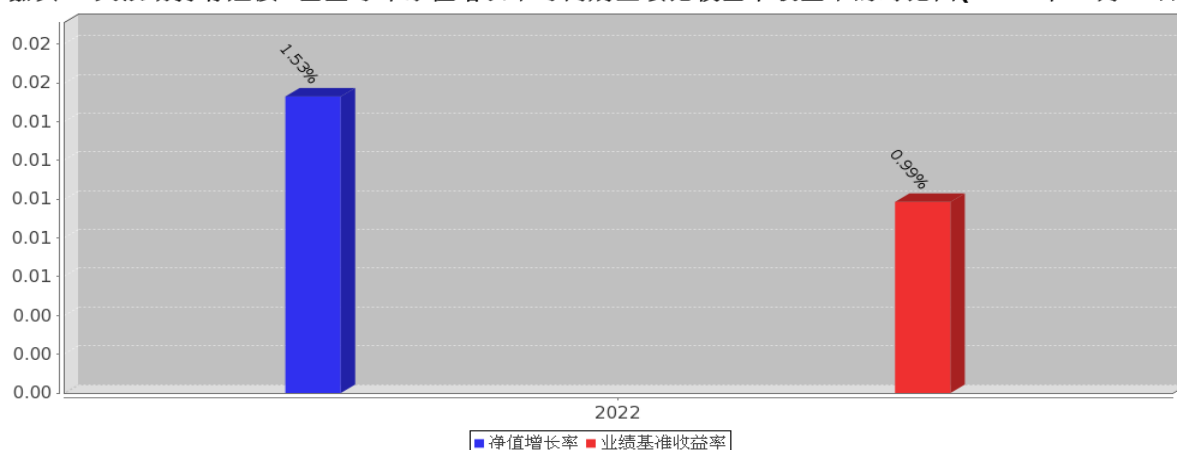
嘉实 90 天滚动持有短债 A 基金每年净值增长率与同期业绩比较基准收益率的对比图(2022 年 12 月 31 日)

注:基金的过往业绩不代表未来表现;基金合同生效当年的相关数据根据当年实际存续期计算。