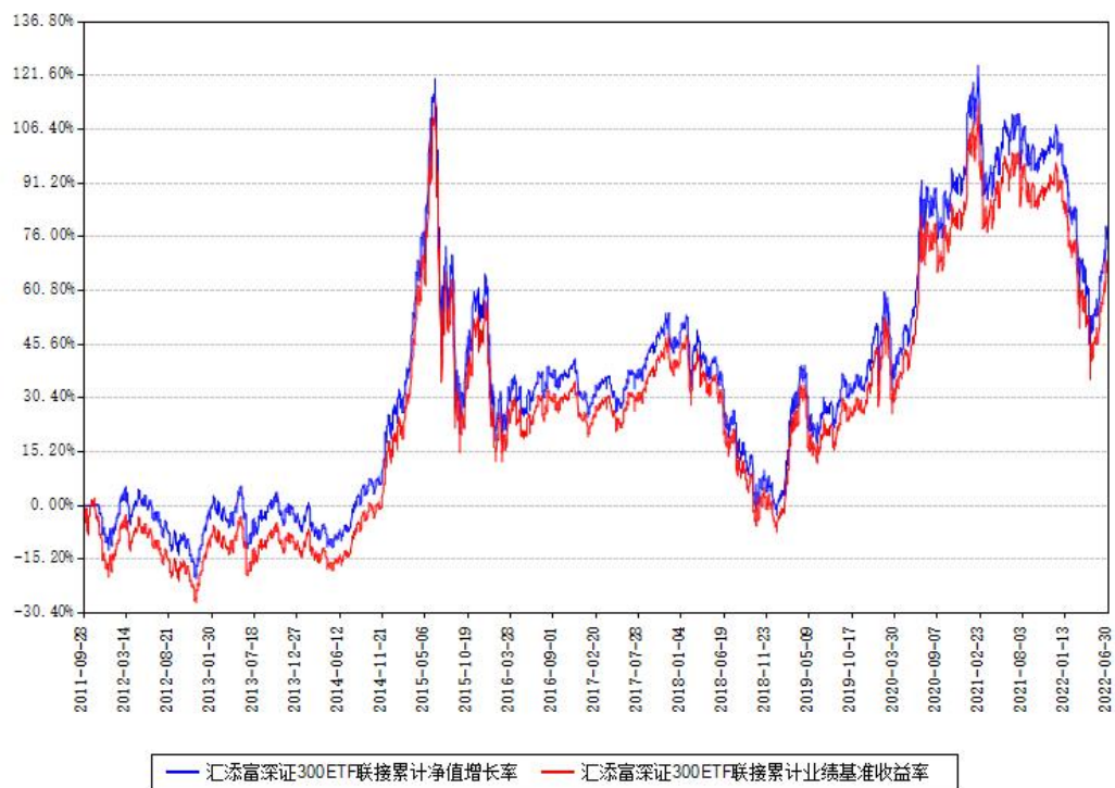
汇添富深证300ETF联接累计净值增长率与同期业绩基准收益率对比图