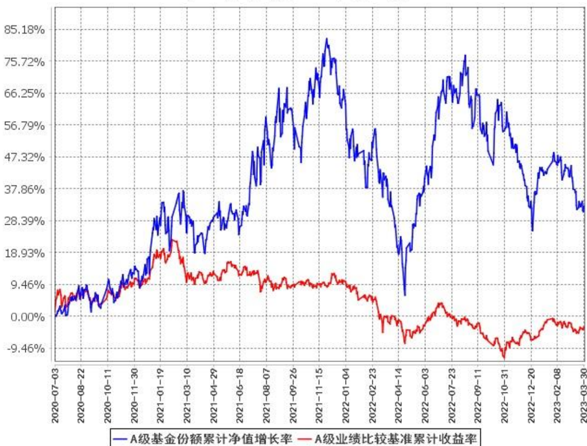
A级基金份额累计净值增长率与同期业绩比较基准收益率的历史走势对比图 (2020年7月3日至2023年3月31日)