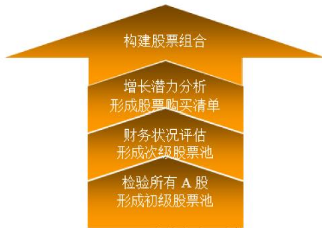
图：本基金选股流程

本基金基金经理将对股票购买清单上的股票进行逐一分析和比较，挑选出其中股价下跌风险最低且上涨空间最大的股票构建具体的股票组合。