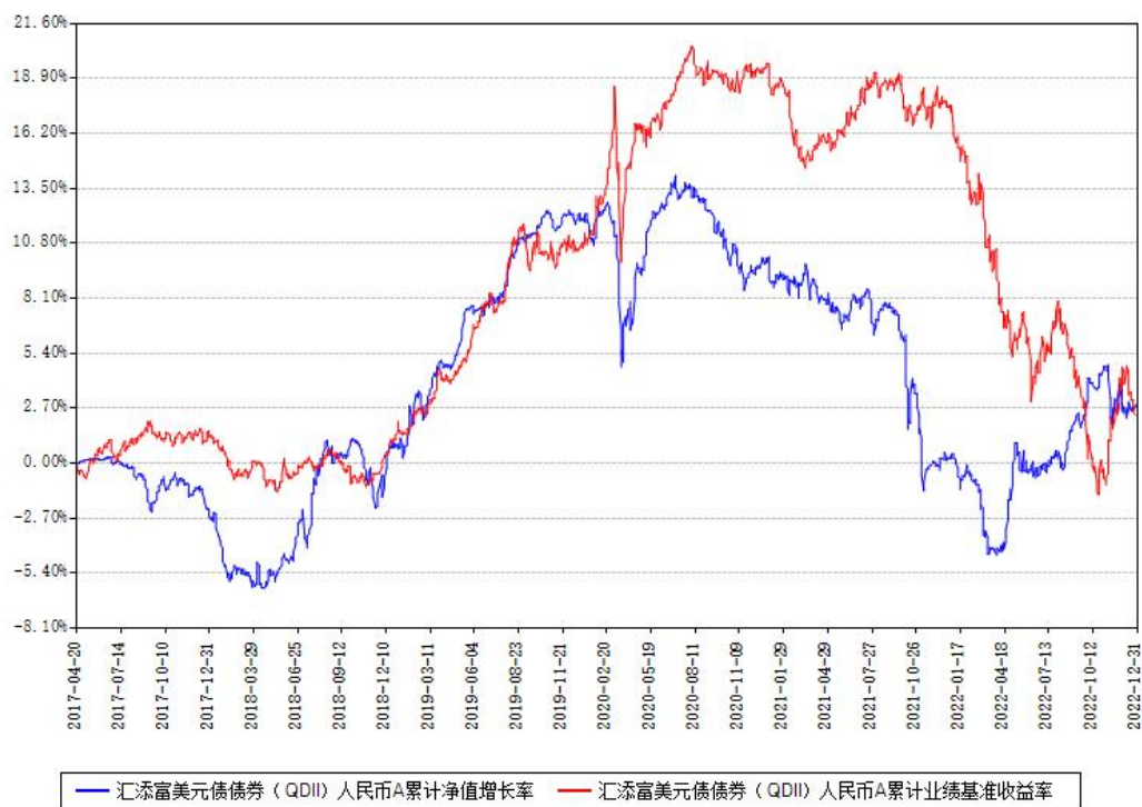
汇添富美元债券（QDII）人民币A累计净值增长率与同期业绩基准收益率对比图

(二) 自基金合同生效以来基金累计净值增长率变动及其与同期业绩比较基准收益率变动的比较图