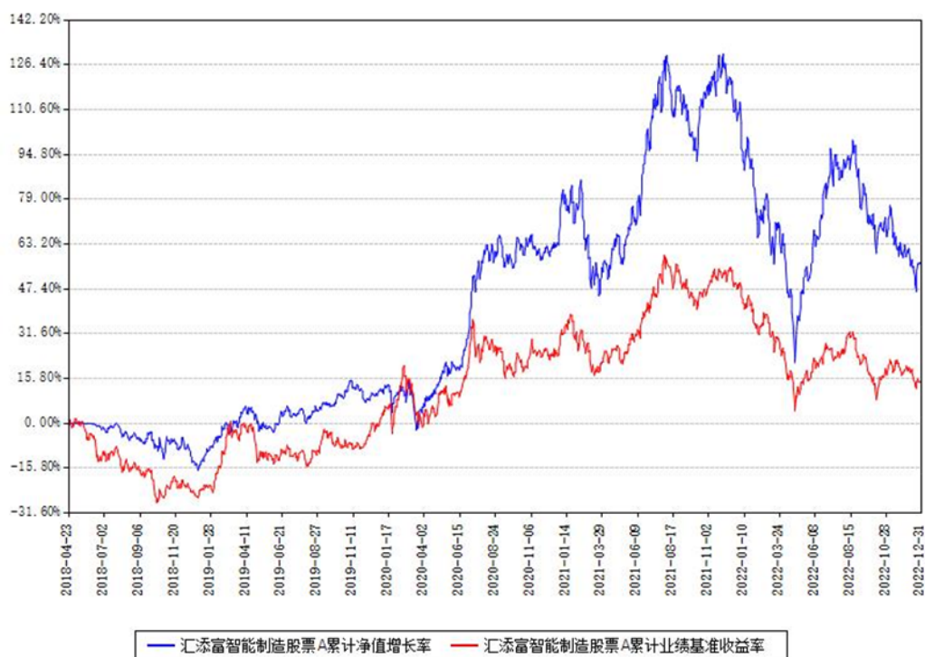
汇添富智能制造股票A累计净值增长率与同期业绩基准收益率对比图