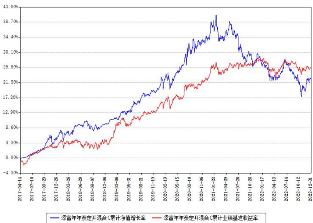
添富年年泰定开混合C累计净值增长率与同期业绩基准收益率对比图