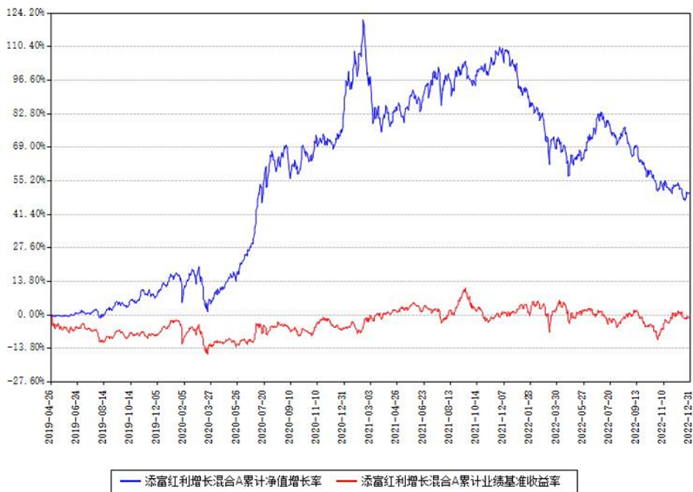
添富红利增长混合A累计净值增长率与同期业绩基准收益率对比图