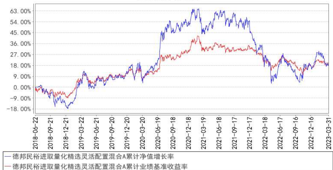
德邦民裕进取量化精选灵活配置混合A累计净值增长率与同期业绩比较基准收益率的历史走势对比图