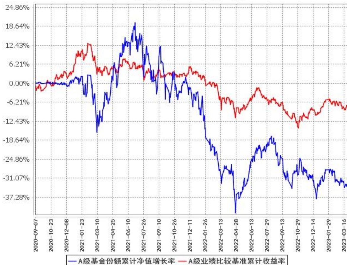
A级基金份额累计净值增长率与同期业绩比较基准收益率的历史走势对比图 (2020年9月7日至2023年3月31日)