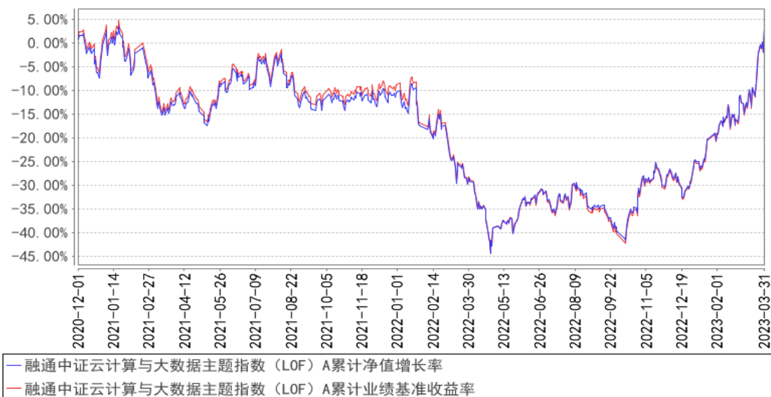
融通中证云计算与大数据主题指数（LOF）A 累计净值增长率与同期业绩比较基准收益率的历史走势对比图