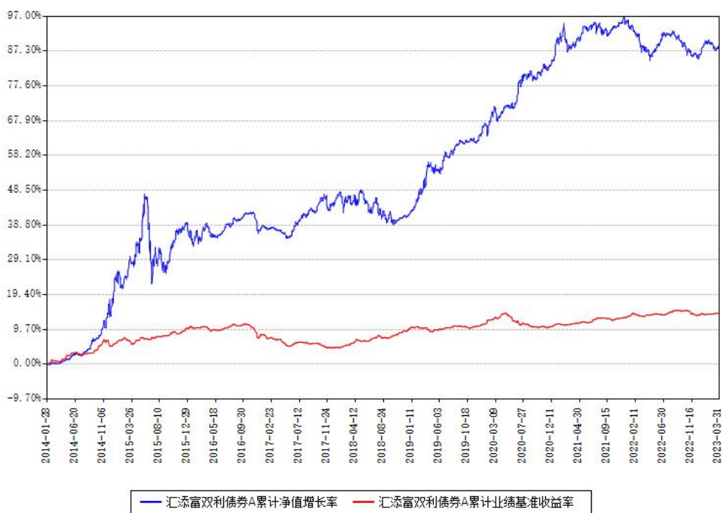
汇添富双利债券A累计净值增长率与同期业绩基准收益率对比图