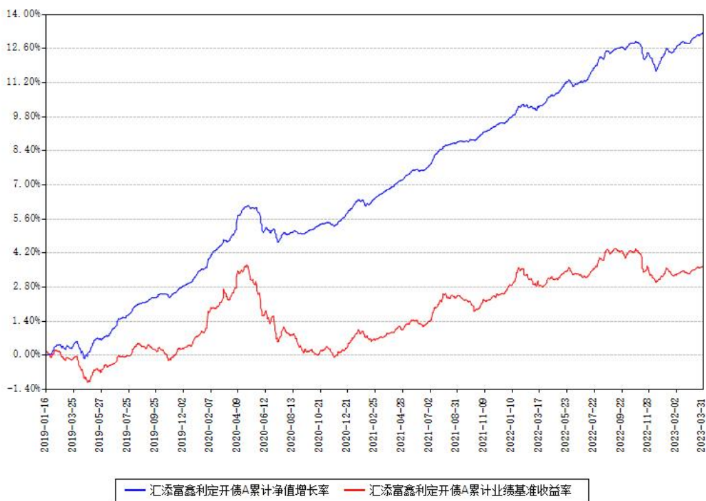
汇添富鑫利定开债A累计净值增长率与同期业绩基准收益率对比图