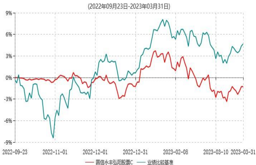
圆信永丰弘阳股票C累计净值增长率与业绩比较基准收益率历史走势对比图

注：自基金合同生效后，截止报告期末，本基金成立不满一年；本基金已完成建仓但报告期末距建仓结束不满一年，建仓结束时各项资产配置比例符合合同约定。