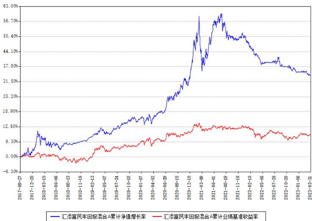
汇添富民丰回报混合A累计净值增长率与同期业绩比较基准收益率对比图