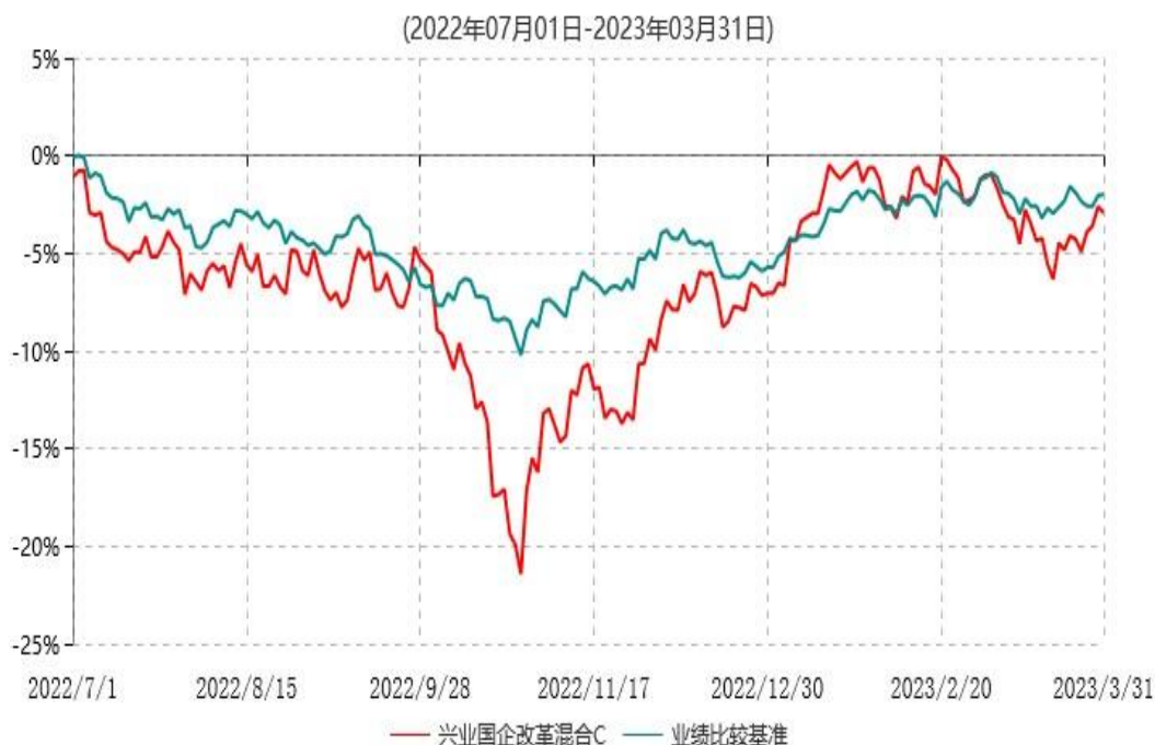
兴业国企改革混合C累计净值增长率与业绩比较基准收益率历史走势对比图

注：1、本基金基金合同于 2015 年 9 月 17 日生效，根据本基金基金合同规定，本基金自基金合同生效之日起六个月内已使基金的投资组合比例符合基金合同的约定。 2、本基金自 2022 年 06 月 17 日起增设 C 类份额，自 2022 年 07 月 01 日起 C 类份额存续，上述业绩表现按实际存续期计算。