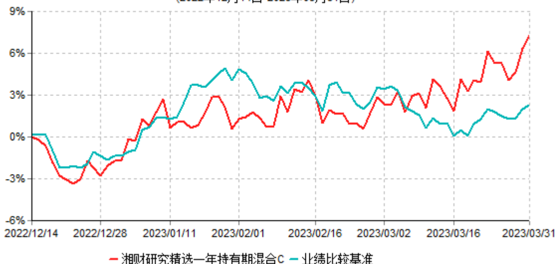
湘财研究精选一年持有期混合C累计净值增长率与业绩比较基准收益率历史走势对比图 (2022年12月14日-2023年03月31日)