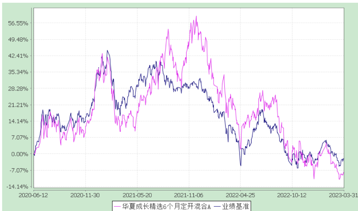
华夏成长精选 6 个月定开混合 C: