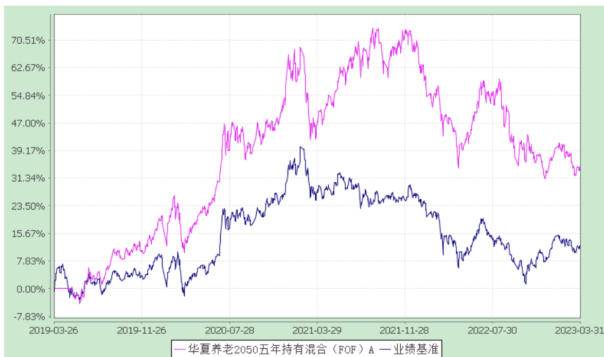
华夏养老 2050 五年持有混合 (FOF) Y: