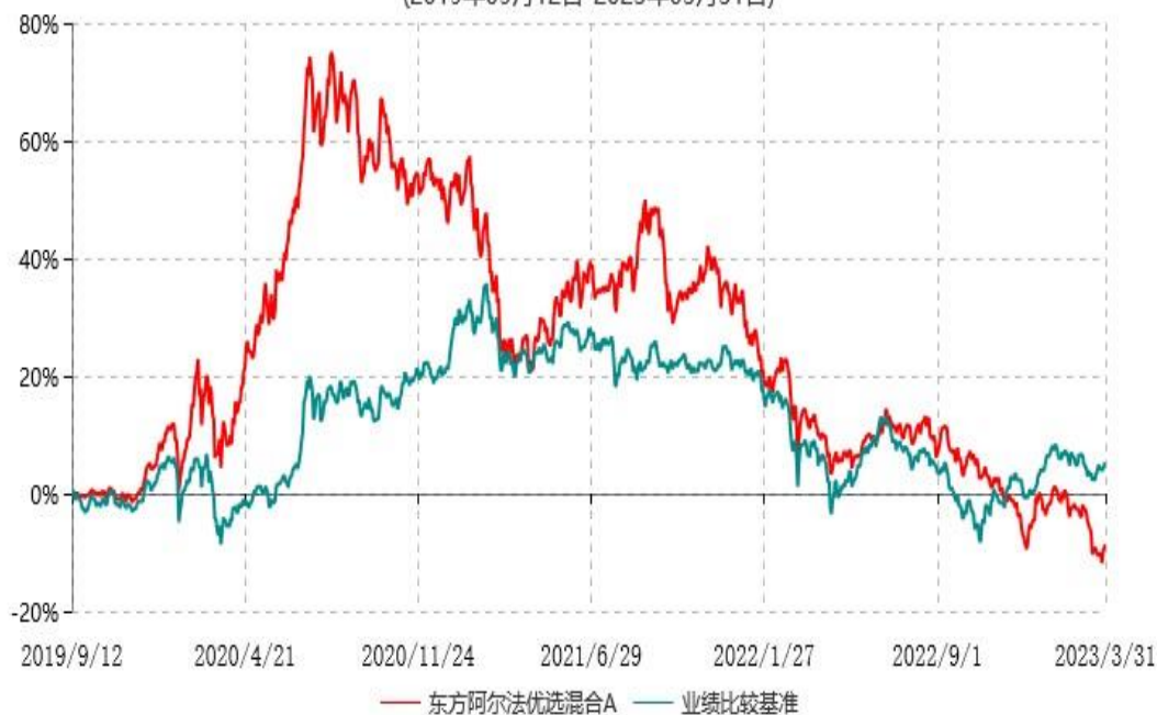
东方阿尔法优选混合C累计净值增长率与业绩比较基准收益率历史走势对比图