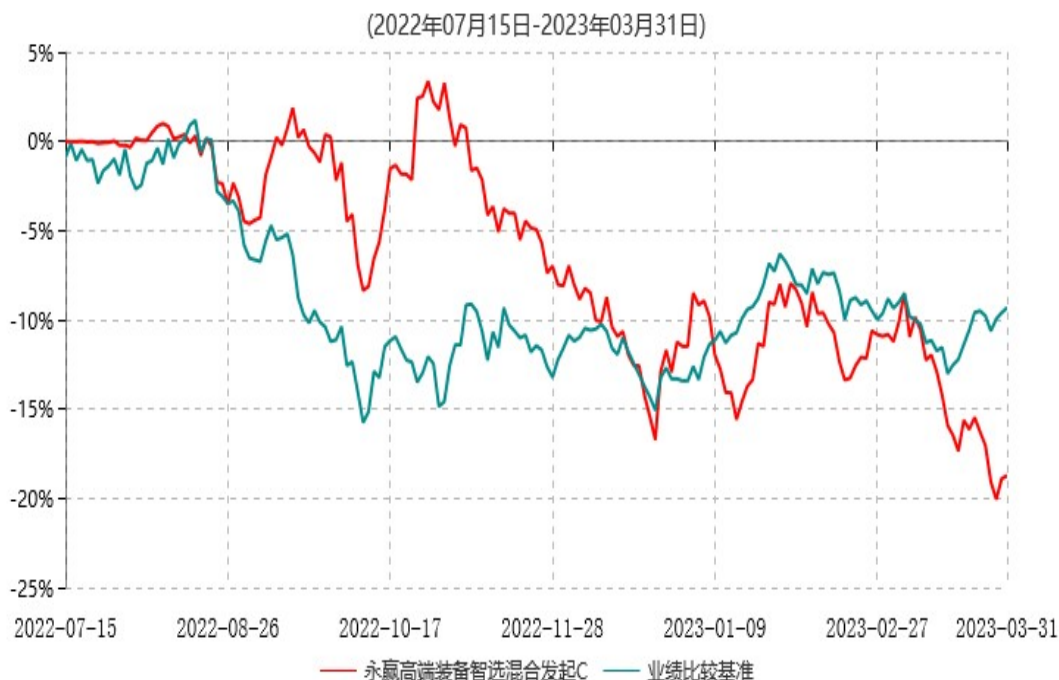
永赢高端装备智选混合发起C累计净值增长率与业绩比较基准收益率历史走势对比图

注：1、本基金合同生效日为 2022 年 7 月 15 日，截至本报告期末本基金合同生效未满一年；