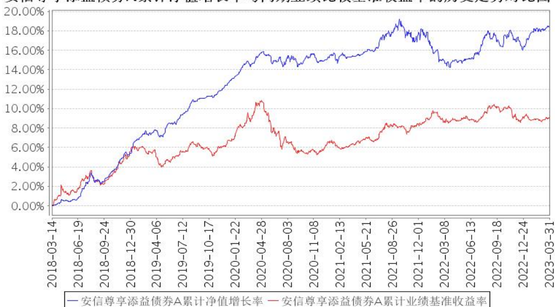
安信尊享添益债券A累计净值增长率与同期业绩比较基准收益率的历史走势对比图