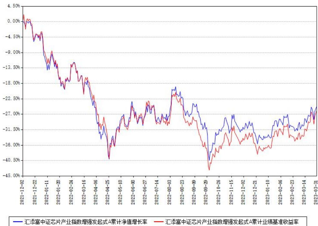
汇添富中证芯片产业指数增强发起式A累计净值增长率与同期业绩基准收益率对比图